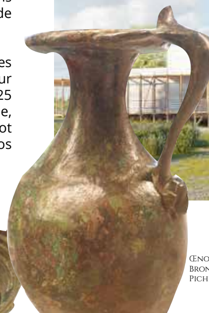
CENOCHOÉ BRONZE PICHET À VIN